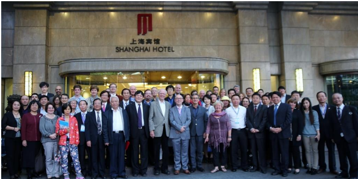
De deelnemers aan de Interstenobijeenkomst te Shanghai, gefotografeerd vóór hun hotel, waar ook de vergaderingen en presentaties plaatsvonden.